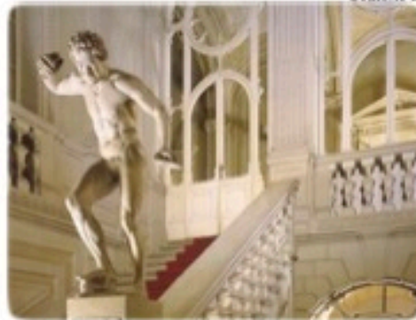
Staircase at Palazzo Gaudenzi